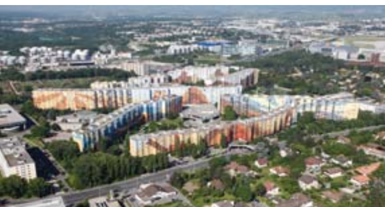
La Cité des Avanchets (6'000 habitant-e-s)